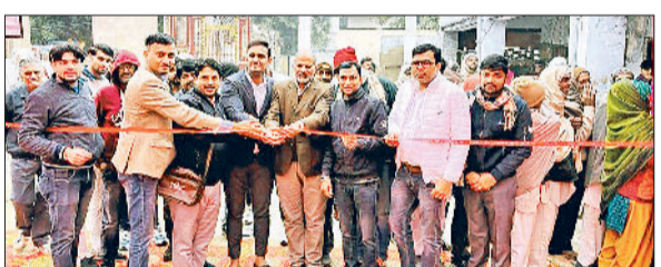
मंडी अटेली। नेत्र चिकित्सा शिविर का शुभारंभ करते हुए।