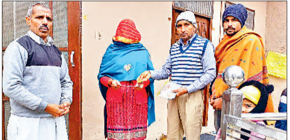
मंडी अटेली। सिहमा में राम मंदिर प्राण प्रतिष्ठा का निमंत्रण देते हुए।