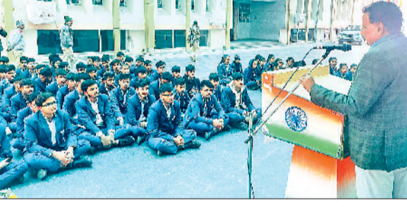
महेंद्रगढ़। कार्यक्रम को संबोधित करते वक्ता।