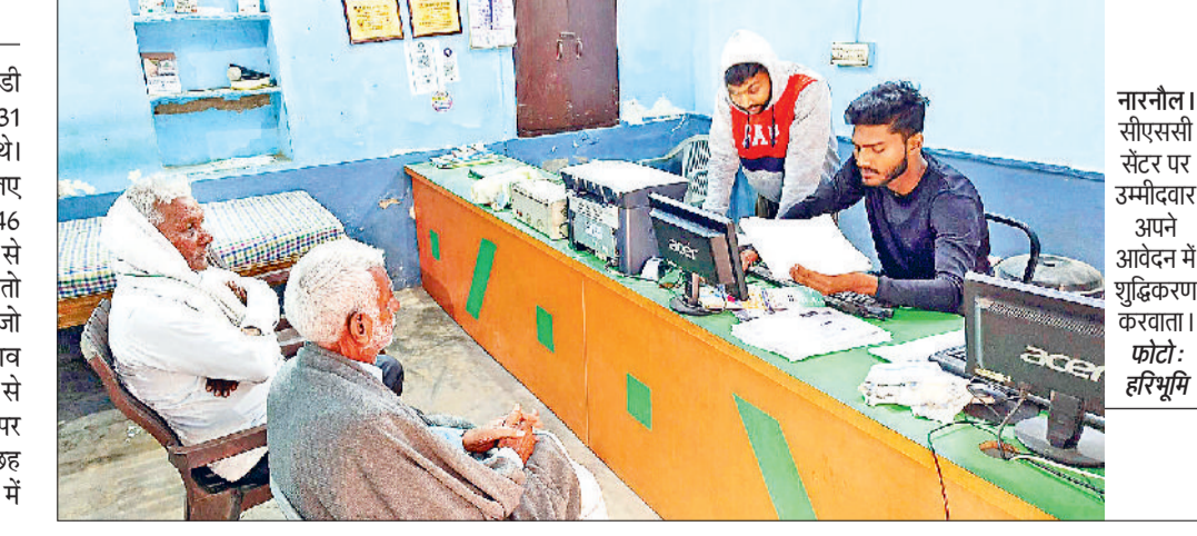
नारनौल। सीएससी सेंटर पर उम्मीदवार अपने आवेदन में शुद्धिकरण करवाता।

कर्मचारी चयन आयोग ने एसएससी जीडी कांस्टेबल की भर्ती प्रक्रिया के लिए 31 दिसंबर तक आवेदन पत्र मांग रखे थे। सैनिक बनने की चाह रखने वाले के लिए सुनहरा अवसर था, चूंकि सेना में 26146 पदों पर भर्ती हो रही है। यदि उम्मीदवार से फॉर्म भरते समय कोई गलती हो गई है, तो उसमें सुधार करने का अवसर दिया है, जो उम्मीदवार अपने आवेदन पत्र में बदलाव करना चाहते हैं, वे ऑनलाइन माध्यम से एसएससी डॉट एनआईसी डॉट इन पर जाकर कर शुद्धि सकते हैं। उम्मीदवार छह जनवरी तक अपने आवेदन फॉर्म में संशोधन कर सकते हैं।