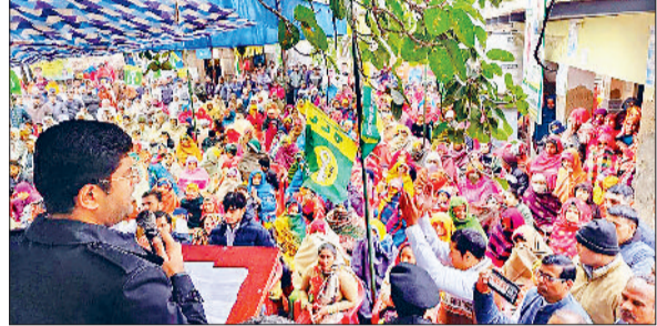
नारनौल। जनसभा को संबोधित करते उप मुख्यमंत्री दुष्यंत चौटाला।

प्रदेश के उप मुख्यमंत्री दुष्यंत चौटाला ने कहा कि प्रदेश में लगातार सड़कों का जाल बिछाया जा रहा है। इसका सबसे अधिक फायदा दक्षिणी हरियाणा को मिला है। हाइवे की बदैलत यह इलाका पिछड़ी से अग्रणी श्रेणी में आ चुका है। अब यह इलाका उद्योग लगाने के लिए सबसे उपयुक्त जगह है। प्रदेश सरकार पदमा योजना के तहत (प्रोग्राम टू एक्सिलेरेट डेवलपमेंट एमएसएमई एडवांसमेंट) युवा उद्यमियों को तैयार करेगी। चौटाला वीरवार को जिले के गांव खेड़ी कांठी, सलीमपुर तुर्कियावास, भोजावास, दौड़गाड़ा जाट, खेड़ी तलवाना, बागौत, उन्हानी में जनसभाओं को संबोधित कर रहे थे।